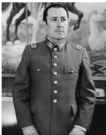
Carlos Prats González

A lo anterior se agregaba el hallazgo de una escuela de guerrilleros en la zona de Valdivia. 16 La organización secreta detrás de esta escuela de guerrilleros era “Organa”, dependiente del Partido Socialista, la que adhería a la tesis del Congreso de Chillán de 1967, en cuanto al empleo de la lucha armada como procedimiento para lograr la revolución socialista. La escuela subversiva había sido instalada en la localidad de Chaihuin, pequeño pueblo costero cerca de Corral 17 y había sido descubierta por un grupo de comandos del Ejército, el 20 de mayo de 1970, por lo que solo había alcanzado a funcionar cinco meses. Se había producido un intercambio de disparos y los subversivos se habían internado hacia la selva valdiviana, siendo capturados, a los dos días del primer incidente, seis guerrilleros, que posteriormente fueron sometidos a proceso. 18