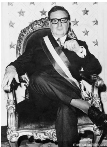
Salvador Allende Gossens

almirante Tirado, sí se involucró en la sedición que terminó con la muerte del general Schneider y posteriormente fue condenado a tres años de prisión. 29