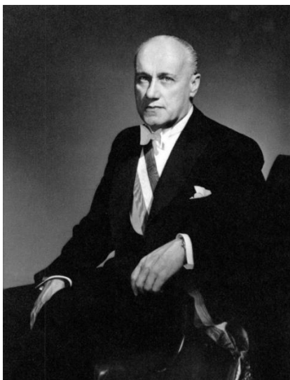
Jorge Alessandri Rodríguez

La inquietud en las filas se hacía creciente. Se supo que en la III División hubo reuniones sediciosas destinadas a que las Fuerzas Armadas asumieran el gobierno y para que fuera el general Viaux el que liderara un golpe de estado. El general Prats aseguraba haber recibido información de un senador, de que el presidente Frei, en una entrevista con Schneider, le había dado a entender que las Fuerzas Armadas debían actuar. Agregaba que, había recibido a un alto dirigente demócratacristiano que le planteó, directamente, que la intransigencia de Schneider para detener a la Unidad Popular hacía que el presidente Frei estuviera dispuesto a que Prats encabezara un movimiento. Este debía derrocarlo y luego enviarlo al extranjero, para posteriormente llamar a elecciones. 24 Prats no menciona al dirigente ni aporta documentación alguna al respecto. Mientras tanto, la Democracia Cristiana negociaba su voto para confirmar a la primera mayoría contra la firma de unas “garantías constitucionales”.