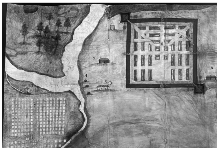
Figura 1. Plano de la villa de San Francisco de la Vega de Angol, 1637